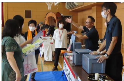
防災グッズの説明↑

参加した方からは「炊き出し訓練での非常食のレシピがとても参考になった。自宅で早速作ってみたい。」「災害時は刻々と状況が変化する。携帯電話などで情報を得るので電源の確保が重要だと改めて実感した。非常用電源の作動方法はもとより、自宅にも非常時に使える電源を確保しようと思う。」などの感想をいただきました。