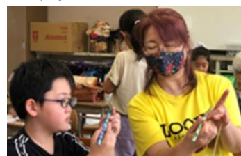
編み物(くさり編み)に挑戦↑

参加する時は保護者の方とお子さんで「子ども教室に参加すること」「帰りは徒歩で帰るかお迎えがあるか」などご確認をお願いします。