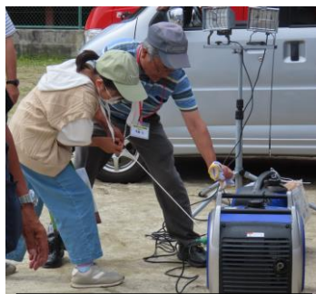
非常用電源 始動訓練↑